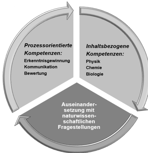
Abb. 1: Kompetenzbereiche der Naturwissenschaften

Der Kompetenzbereich „Erkenntnisgewinnung“ umfasst naturwissenschaftliche Denk- und Arbeitsweisen. Dazu gehören u. a.: