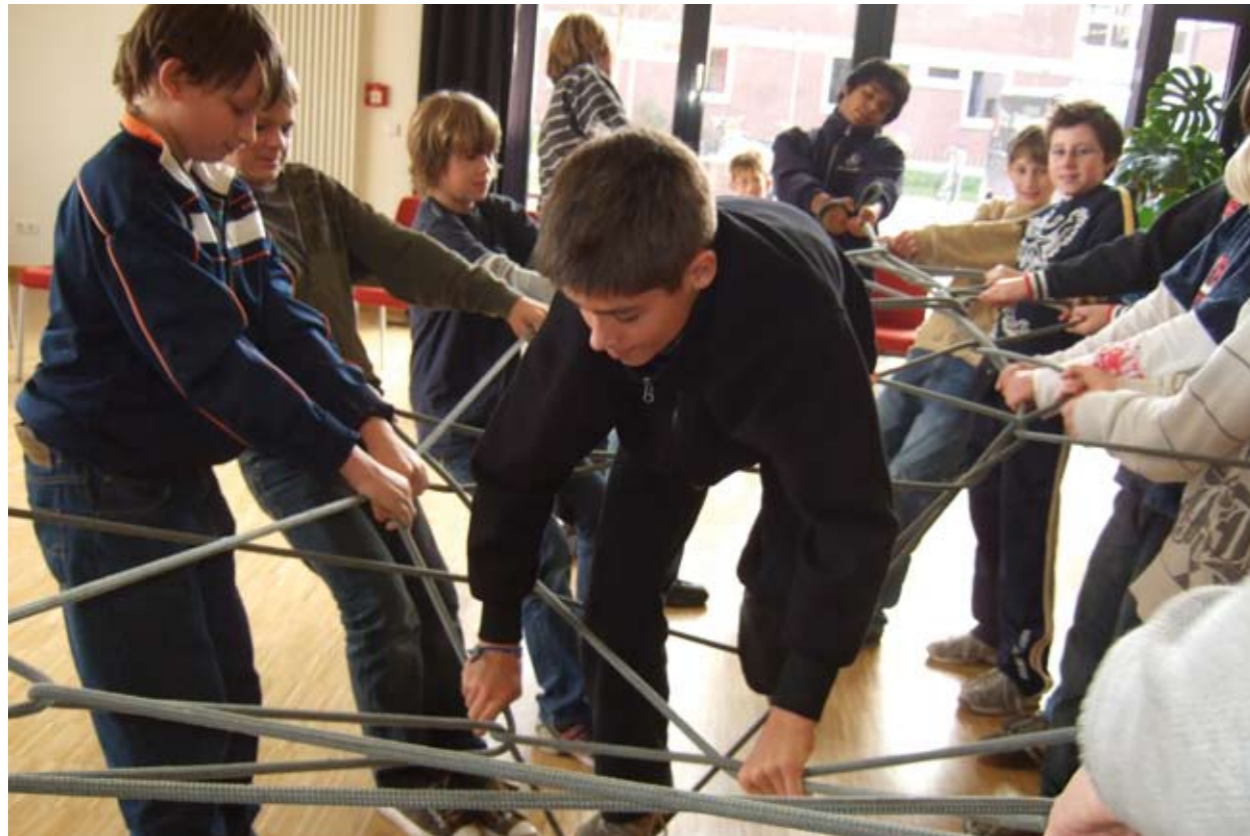
„Jungenarbeiter brauchen ein offenes Herz und offene Ohren“